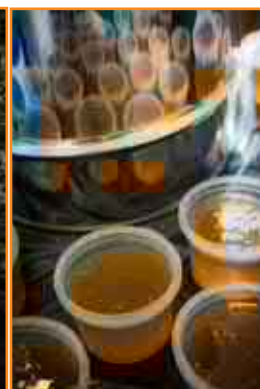
Palstaviljely & mehiläishoito