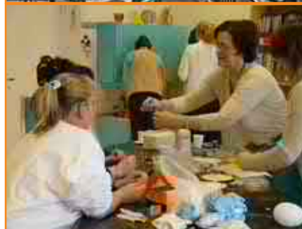
Ryhmät & kerhot