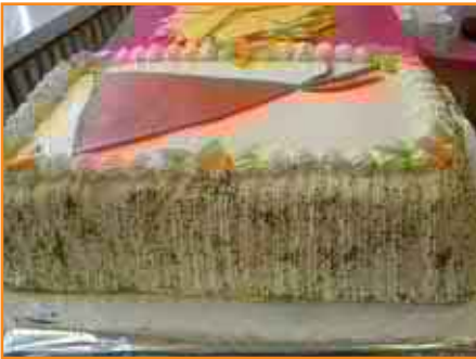
Buffetti & torstairuokailu