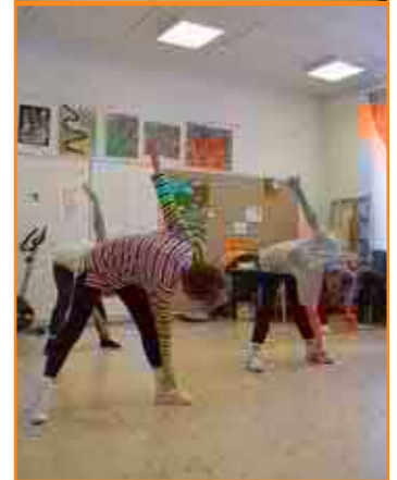
Liikunta & hyvinvointi