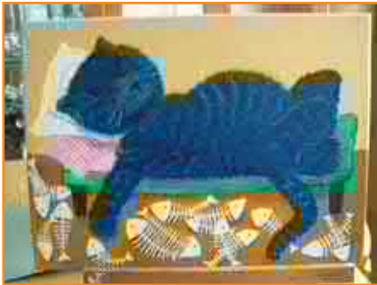
Ilse Berlin: "Olipa hyvää"