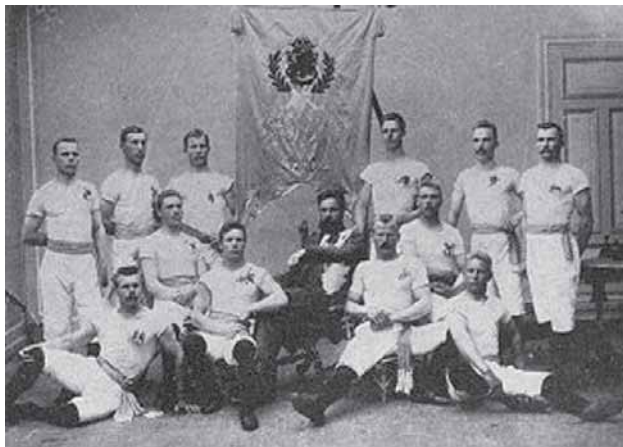
Vuonna 1903 voitti Ponnistuksen miesjoukkue hopeastandaarin Viipurin voimistelujuhlilla.