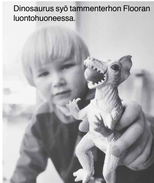
Dinosaurius syö tammenterhon Flooran luontohuoneessa.