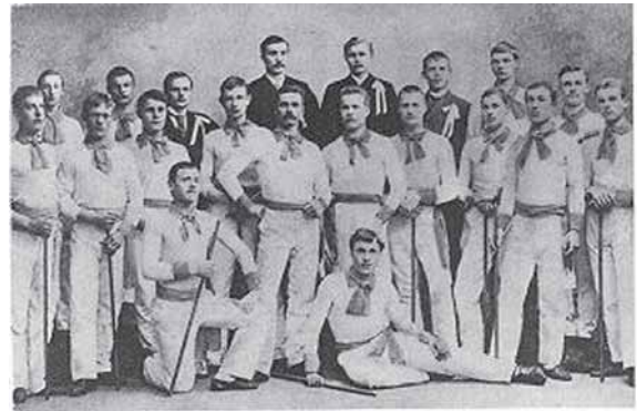
Ponnistuksen voimistelujoukkue vuodelta 1888.