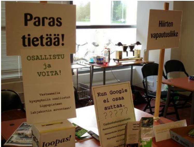
Kiertueen mielenosoituskylttejä ja muuta materiaalia infotiskeilla Myyrmäen kirjastossa

Tietokilpailun lisäksi myös kahvi-, karkki- ja mehutarjoilu houkutteli asiakkaita pysähtymään. Riippuen kirjaston tiloista järjestettiin kahvitarjoilu joko infotiskien tai elävien viranhaltijoiden läheisyydessä. Kahvitarjoilu pidettiin tarkoituksella lähellä viranhaltijoita, koska tarjoilun ideana oli luoda juuri olohuonemainen tunnelma. Mehu ja karkit pidettiin infotiskien vieressä. Erityisesti lapset innostuivat tietokilpailuun osallistumisesta siinä vaiheessa, kun palkkioksi luvattiin karkki ja mukillinen mehua.