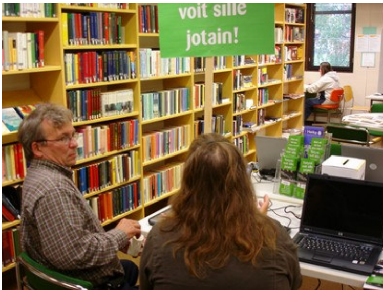
Tutustumista kaupungin sivuihin ja seutuportaaliin Hämeenkylässä kirjastossa.

Infotiskeillä pysähtyi kaikenikäisiä ihmisiä. Tietokilpailu oli hyvä houkutin erityisesti nuorempien asiakkaiden kohdalla. Vanhemmilla ihmisillä oli paremmin aikaa pysähtyä kuuntelemaan ja istahtaa myös koneen äärelle, kun nuoret täyttivät kilpailukupongin itsenäisemmin.