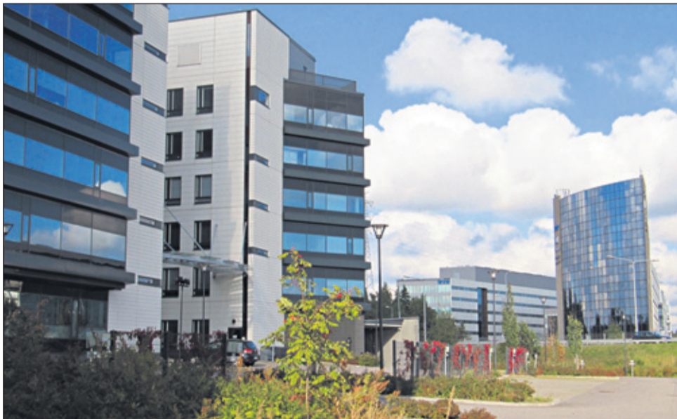
Käpylän aseman seutu on keskeinen Pohjois-Helsingin solmukohta tulevaisuudessa.