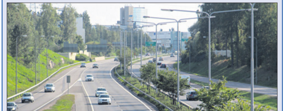
Tuusulanväylästä suunnitellaan kaupunkibulevardia, jotta sen ympäristö voidaan rakentaa tehokkaasti

Lisätietoja www.kaupunginosat.net/ruohonkarjet