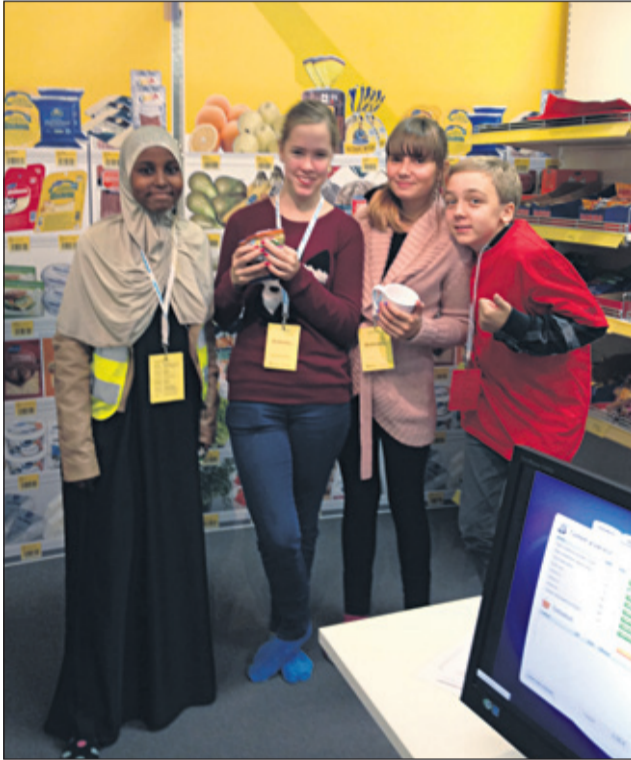
Yrityskyläläisiä Maunulan koulussa.

Itse työskentelin yrityskylän Alepassa toimitusjohtajana. Olin koko ajan innoissani yrityskylästä, enkä kyllä hirveästi pettynytään. Yllätyin iloisesti työn haastavuudesta, ja alaisteni neuvomisesta. Alepan tuotteiden järjesteleminen hyllyille oli aika haastavaa, mutta hauskaa. Yleisesti koko luokkamme piti tästä kokemuksesta, ja haluaisi varmasti uudelleenkin.