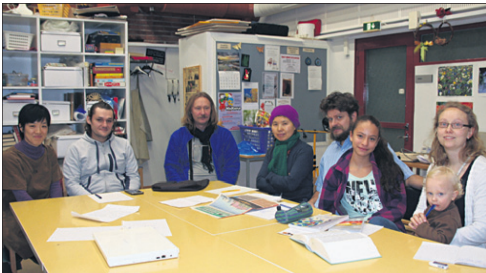
Suomen kieltä oppimassa.

Lehtijutun ovat kirjoittaneet suomen kielen kerholaiset.