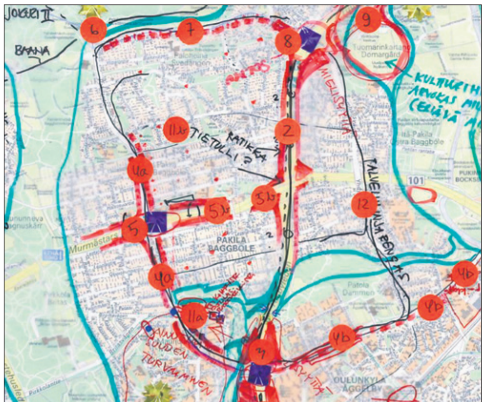
Ksv:n yleiskaavapajoissa maaliskuussa asukkaat ideoivat karttojen ääressä asuinalueiden kehittämistä.