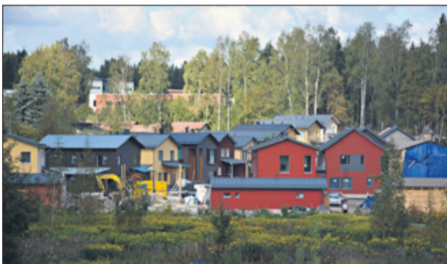
Uusia pientaloja nousee Suursuolle nopeassa tahdissa.

luvulta lähtien. Vhreän keskuspuiston kupeessa olevan alueen tunnetuimpia taloja ovat esimerkiksi Hilding Ekelundin suunnittelemat rivi- ja kerrostalot. Maunulaa täydennysrakennetaan nyt aktiivisesti ja ostaria odottaa purkaminen. Miten Maunulan ainutlaatuisen henki säilyy jatkossa?"