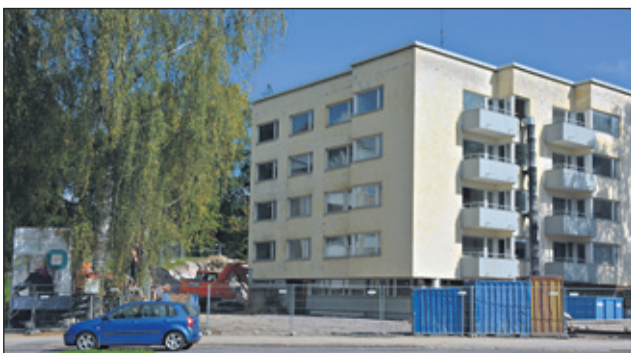
Pakilantie 17:n tontille Sato rakentaa lisärakennuksen ja samalla peruskorjaa nykyisen rakennuksen. Hissi rakennetaan vanhan ja uuden rakennuksen väliin.