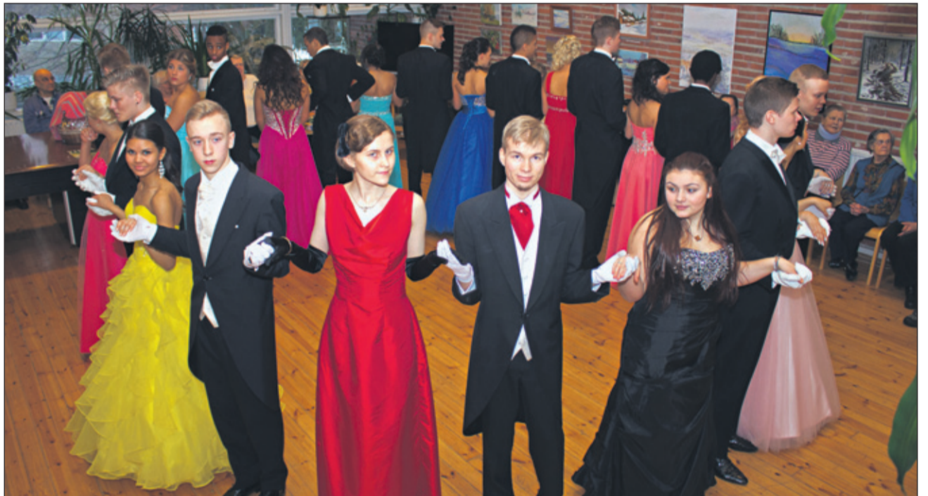
Vanhat valtasivat Saunabaarin.

MAYK:n vanhojen tans- seissa pyörähteli 56 paria. Torstai-iltana 23.2. tanssi- jat hurmasivat sukulais-