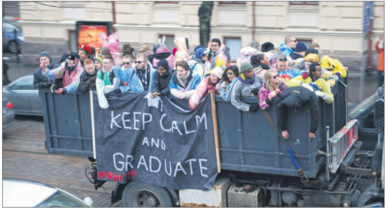
Perinteiset Penkkariajot järjestettiin jälleen 13.2. Kuvassa yksi MAYK:n autoista.

Paikka: Asukastalo Saunabaari, Metsäpurontie 25, 3. krs. Maunulasali.