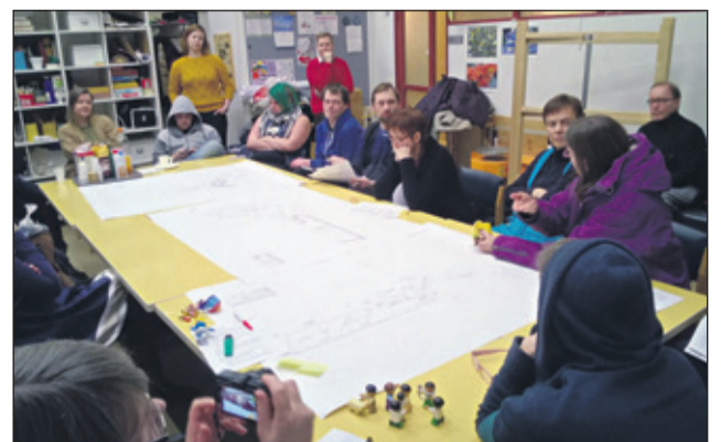
Maunulalaiset suunnittelivat työväenopistonuorisotalo-kirjaston uudisrakennusta Arkkitehtuurityöpajassa 30.1.2014.