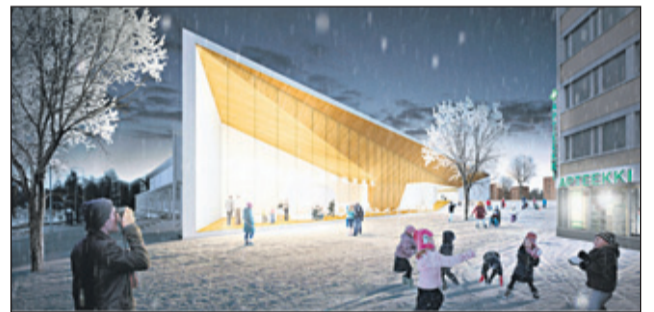
Arkkitehtitoimisto K2S on suunnitellut Maunulan kirjaston, työväenopiston ja nuorisotoimen yhteisen rakennuksen.

Arkkitehtuurityöpaja peräänkuulutti puistosuunnittelua. Helsingin kaupunginhallitus päätti hyväksyessään hankkeen 3.2.2014, "että monitoimitalon luona olevan puistoalueen kehittämiseksi tehdään nykyisten määrärahojen