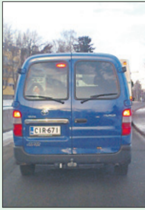
Tämä näkymä on todennäköinen, jos ajat nopeusrajoitusten mukaan.

Vanhan aapiseni liikenneruno tuli mieleeni, kun tammikuuisena aamupäivänä ajoin Pakilantien sillalla. Ajamani nopeusrajoituksen mukainen meno tuntui erittäin lähellä takanani roikuvan pakettiauton kuljettajasta ilmeisesti hidastelulta, koska hän vaihtoi kaistaa ja ohitti minut ripeästi. Nopeusrajoitus vaihtui 30 km/h:ssa, ja hidastin, mutta pakettiauto vain kiihdytti vauhtiaan. Turhaa oli kaahailu, sillä ostoskeskuksen pysäkillä odottelimme tovin bussin perässä. Pakollisen pysähtymisen jälkeen pakettiauto sitten ohitti koko letkan kääntyäkseen Pakilantien 18 pihaan. Sitä ennen ehdin nähdä,