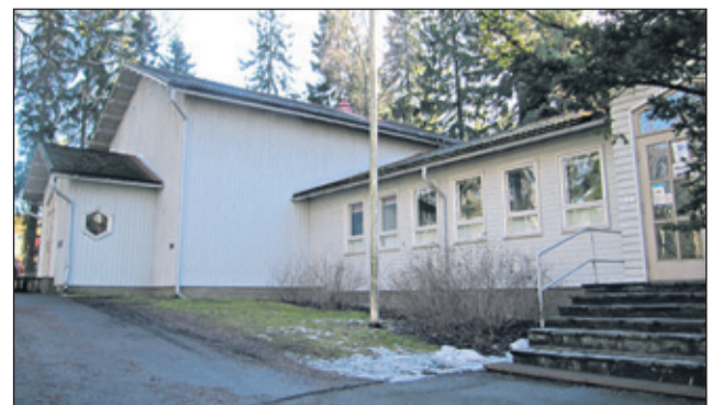
Uhkaako seurakuntataloa purkaminen?

Seurakuntayhtymä on irtisanonut Maunulan seurakuntatalon eli Seuriksen (Maunulantie 21) tontin vuokrasopimuksen. Vuokrasopimus edellyttää vuokralaiselta rakennuksen purkamista sopimuksen päättyessä. Rakennusta ei ole suojeltu asemakaavalla. Monet järjestöt ja ryhmät käyttävät Seurista toimintatilana.