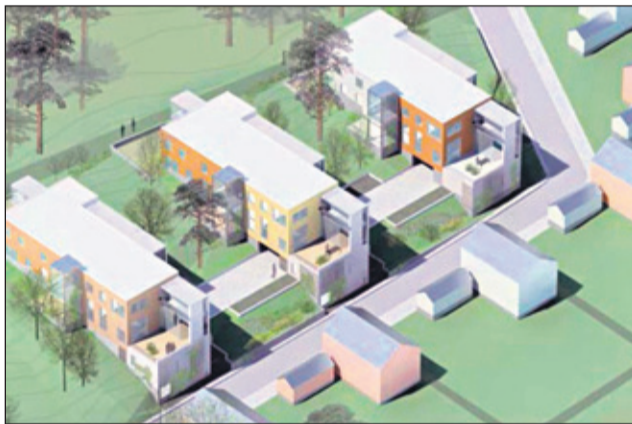
Suopellonkaaren pienkerrostaloista on myytävänä muun muassa loft-asuntoja

opintoihin mm. Otaniemen Teknilliseen korkeakouluun. Esitteessä korostetaan asuk- kaiden hyvää yhteishenkeä ja aktiivista asukastoimin- ta.