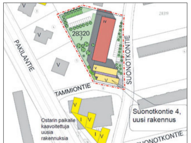
Suonotkontie 4:n tontille tulee lisärakennus ja myös uut- ta liiketilaa.

Kaupunginvaltuusto hyväk- syi 29.1.2014 Suursuon Suo- notkontie 4:n ja Suursuon- tie 14:n asemakaavamuutokset. Muutos mahdollis- taa täydennysrakentami- sen kahdella kerrostalotontilla hyvien palvelujen ja lii- kenneyhteyksien läheisyy- dessä. Uutta kerrosalaa tulee yhteensä 3 150 k-m 2 , mikä tarkoittaa n. 80 uutta asukasta. Tavoitteena on lisätä asuntotarjontaa ja esteettömiä asuntoja, moni- puolistaa asuntokantaa sekä turvata palvelujen säily- minen kasvattamalla asu- kasmäärää.