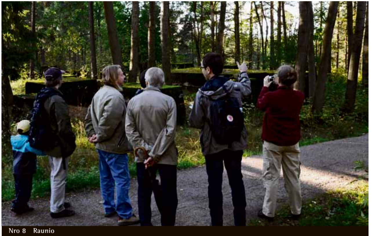
Nro 8 Raunio

Puistossa järjestetään vuosittain kesäkuussa maksuton Pihlajamäki goes Blues -tapahtuma.