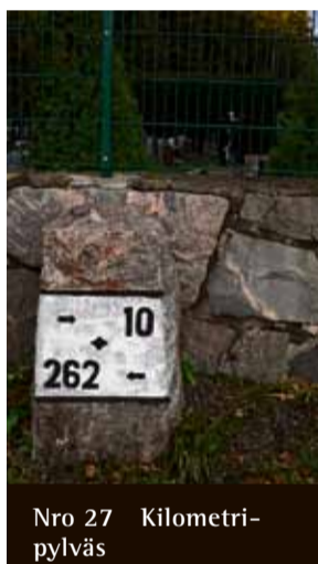
Nro 27 Kilometripylväs

Lähimmät korttelit on rakennettu 1983–88. Vuoden 2010 asemakaavassa on osoitettu Johtokiventien länsireunalle paikka uudelle 2–5-kerroksiselle terrassitalolle, jonka läpi kävelytie kulki ostarin suuntaan.