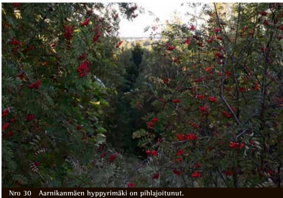
Nro 30 Aarnikanmäen hyppyrimäki on pihlajoitunut.

Porraskallioiden vanhempi nimi oli Stallberget lähellä olleiden tsaarinajan hevostallien mukaan. Kalliosta hakattiin 1930-luvulla työttömyystöinä Helsingin kaupungille katukiviä (nupukiviä) ja jopa Tallin-