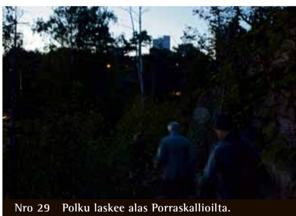
Nro 29 Polku laskee alas Porraskallioilta.

nan sotilasakatemian portaat. Tämän seurauksena kallio alkoi muistuttaa portaita ja sai nykyisen nimensä.