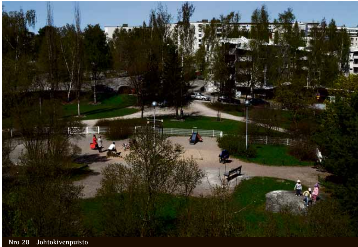
Nro 28 Johtokivenpuisto

Vanhan maantien varrella on ollut asutusta pitkään. Johtokivenpuistokin on vanhaa pihapiiriä, josta jäljellä mm. syreeniä. Leikkikenttä rakennettiin 1980-luvulla. Viime vuosina kaupunki on kunnostanut puistoa ja hankkinut mm. uudet leikkivälineet.