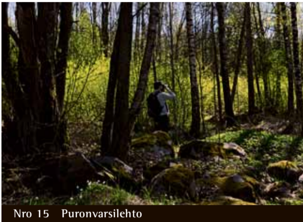
Nro 15 Puronvarsilehto