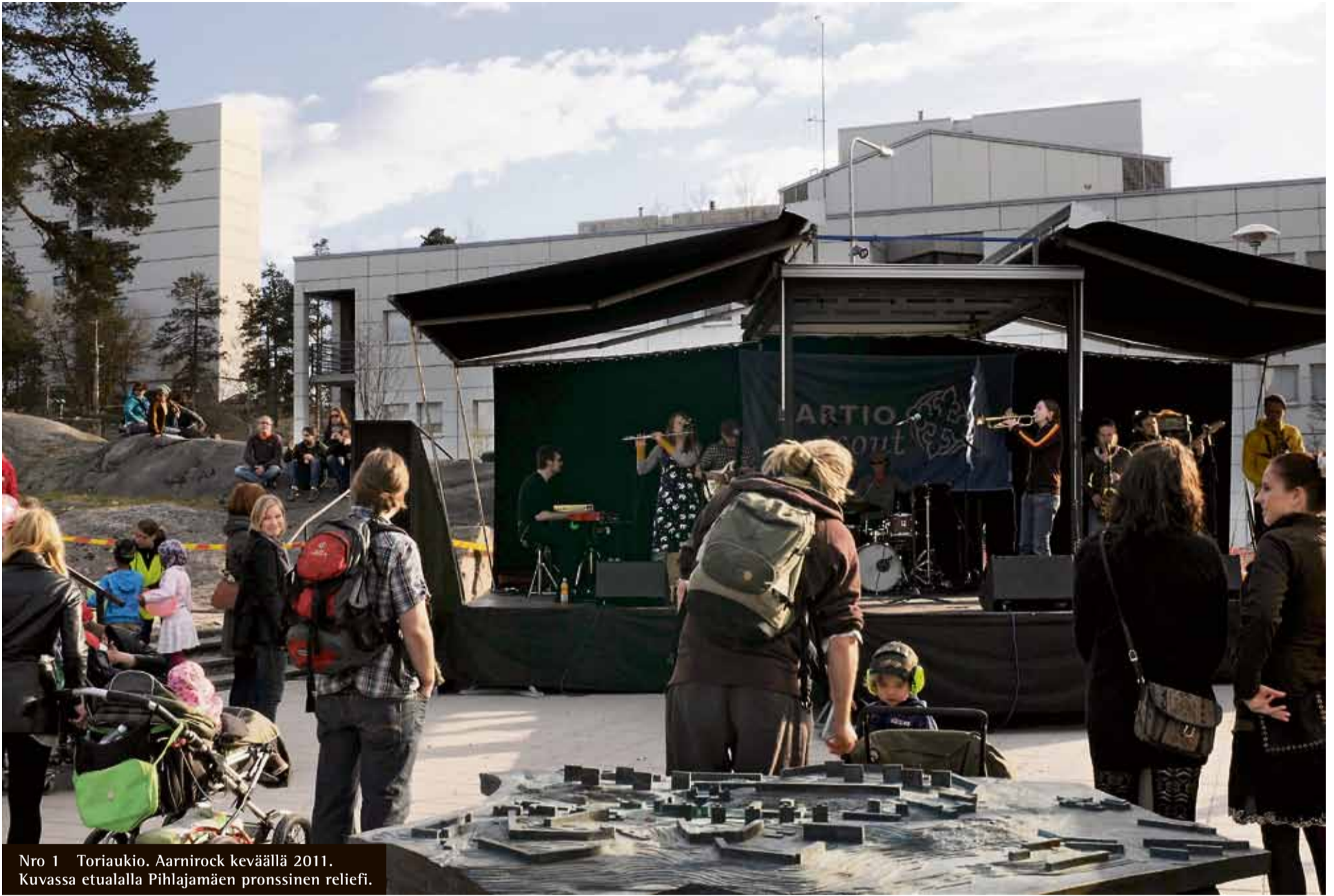
Nro 1 Toriaukio. Aarnirock keväällä 2011. Kuvassa etualalla Pihlajamäen pronssinen reliefi.