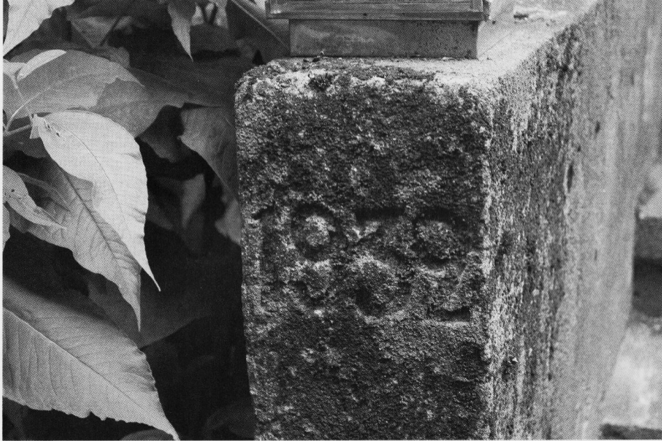
Päärakennuksen betoniporras on ajan patinoima, mutta siitä erottuu vielä talon valmistumisvuosi 1932.