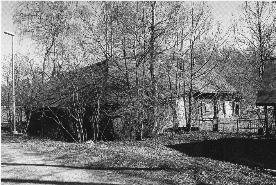
Muistona aikanaan harjoitetusta maa- ja karjataloudesta Laiholan tontilla seisoi vielä äskettäin ulkorakennus, joka käsitti navetan, tallin ja puimalan. Kohta sen jälkeen kun tämä valokuva oli otettu se syttyi 25.4.2014 tuntemattomasta syystä tuleen ja tuhoutui.