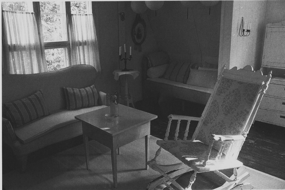
Nykyiset asukkaat ovat sisustaneet talon ajan henkeen sopivilla kalusteilla. Yläkerran oleskelunurkkaus.