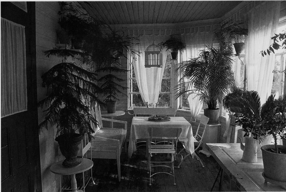
Laiholan talon länsipäädyssä on valoisa lasikuisti, jossa viihtyvät perinteiset koristekasvit. Lähellä sijainnutta Malmin lentokenttää pommitettiin jatkosodan aikana, mutta talo säästyi osumilta. Yksi pommiputosi helmikuussa 1944 niin lähelle, että kuistin ikkunat särkyivät.