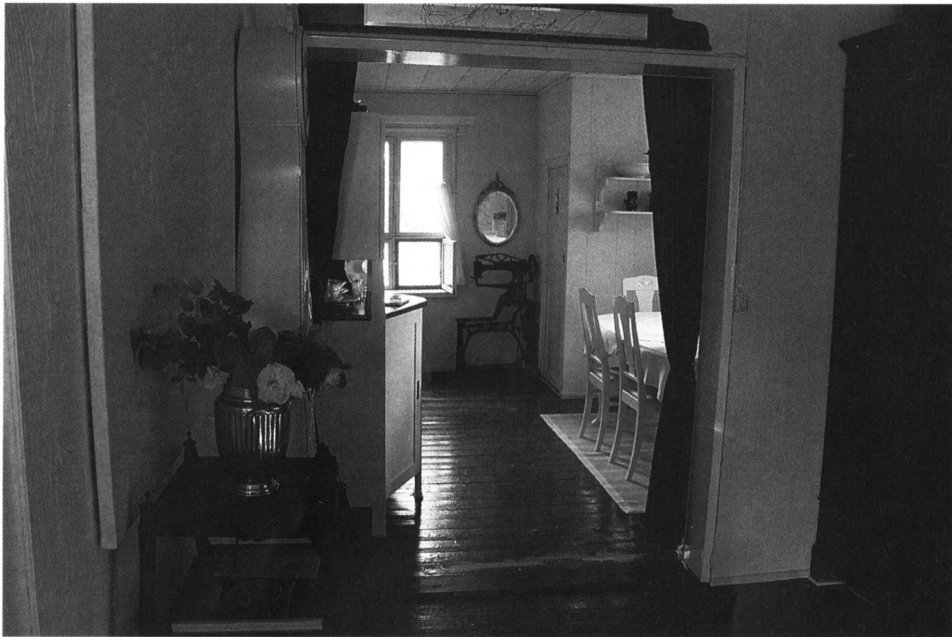
Näkymä yläkerrasta. Oikealla ruokailutila ja peränurkassa nahan ompeluun soveltuva lujatekoinen ompelukone, jollaisia suutarit käyttivät.