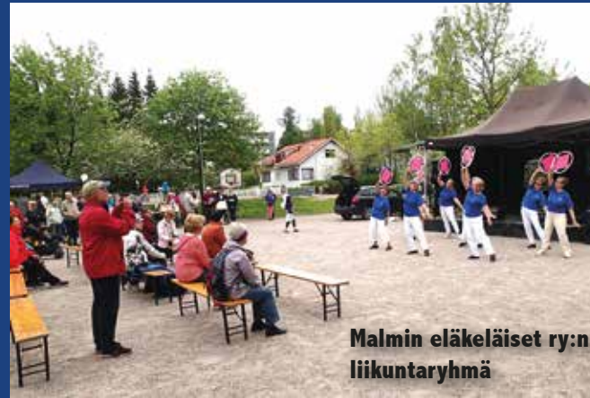
Malmin eläkeläiset ry:n liikuntaryhmä