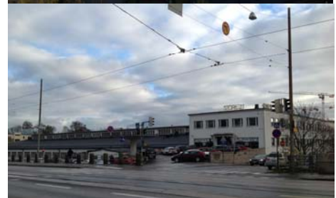
Sturenkatu 21, katso: www.sture21.fi