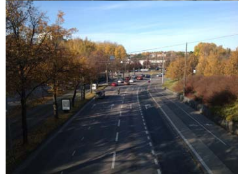
Yllä Mäkelänkatu Alla Hämeentien silta